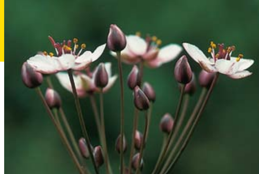
Bloeiende zwanebloem.

Destijds waren eb en vloed tot in het Zuidlaardermeer merkbaar, dat is er de oorzaak van dat zich hier geen veen kon vormen. Vroeger stonden ook enorme oppervlakten van de vochtige graslanden van de Oostpolder onder water. In de achttiende eeuw is men met behulp van windmolens begonnen het waterpeil zo te verlagen dat de graslanden als hooi- en weilanden bruikbaar werden. Dit gebied is een vogelbeschermingsgebied, onder andere omdat de bijzondere kleine zwaan hier overwintert.