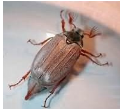
Meikever: melolontha melolontha

Met een hard zoemend geluid zoefden ze voorbij, waarbij het leek dat ze alleen rechtdoor konden vliegen. Misschien dat ze juist daarom zo zoemden. Om aan alle medeluchtgebruikers duidelijk te maken 'Aan de kant, hier komt een meikever, en die kan alleen rechtdoor'.